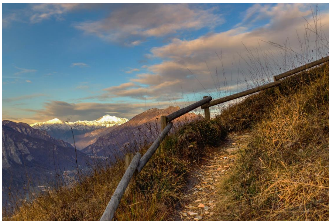
“Il sentiero dei fiori”