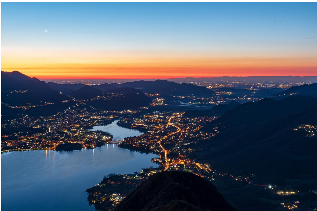
Secondo classificato “Alba al Barro” Gabriele Sala – Triuggio