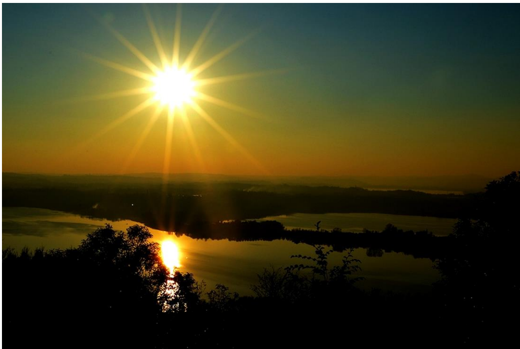
Terzo classificato a pari merito "Riverbero" Ferruccio Castelli – Galbiate