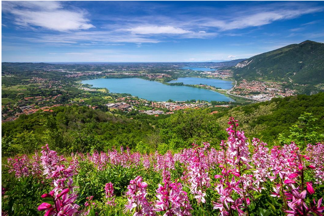
Primo classificato “Rosso dominante” Pio Rota – Almenno S. Salvatore