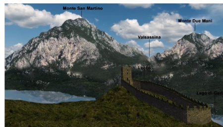
Ipotesi ricostruttiva sulla base dei dati attuali, di come si poteva presentare il sito nel XIV sec. d.C.