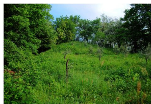
La sommità della collina al momento della scoperta nel 2007