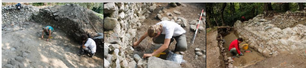
Gli archeologi al lavoro all'interno della torre

Le fasi di occupazione più antiche restano tuttavia ancora tutte da indagare, dato che lo scavo, non ancora concluso, si è concentrato per il momento sulle fasi di occupazione Basso Medievale.