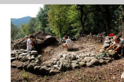
Fasi di scavo nella torre