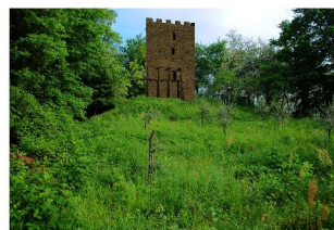
La sommità della collina con la ricostruzione ipotetica della torre