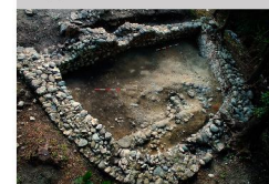
Foto generale della torre durante lo scavo

La fortificazione occupava un luogo strategico per il controllo del territorio, essendo ubicata in una posizione dominante molto panoramica a ridosso dell'Adda, tra il Lago di Lecco e quello di Garlate, e punto di passaggio obbligato per le vie di comunicazione tra la pianura e le aree alpine. All'epoca dell'insediamento la visibilità sul territorio doveva essere molto maggiore di quello che si percepisce attualmente, dato che la vegetazione veniva diradata e tenuta bassa appositamente.